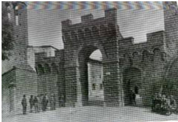
Piancastagnaio: veduta dell'ingresso del borgo, primi '900